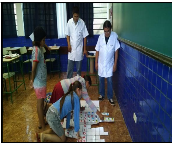
Práticas pedagógicas desenvolvidas nas terras indígenas com temas sobre cultura e língua guarani. PIBID – Diversidade 2016