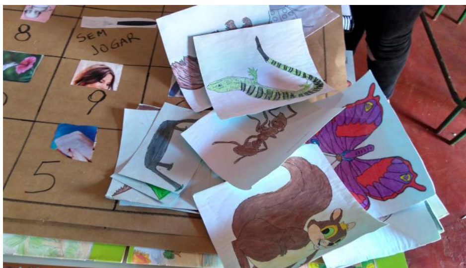
Materiais produzidos por professores e estudantes guarani. T. I Posto Velho