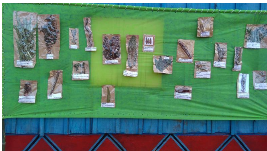
Materiais produzidos por professores e estudantes guarani. T.I. Posto Velho