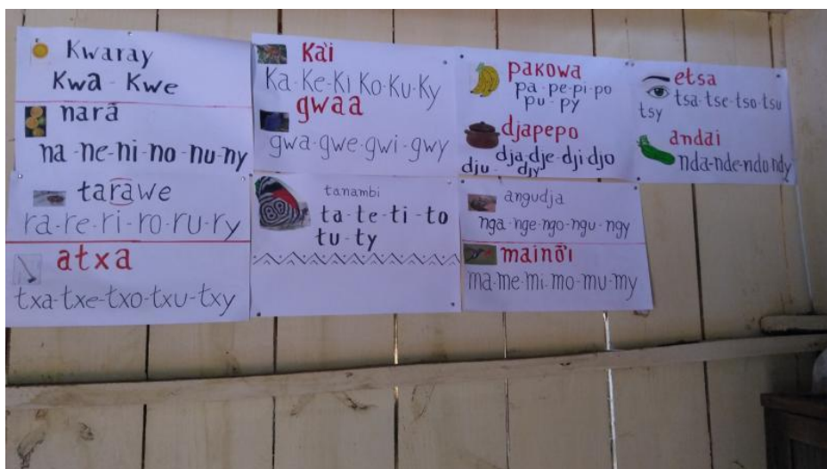
Materiais produzidos por professores e estudantes guarani. T.I. Posto Velho