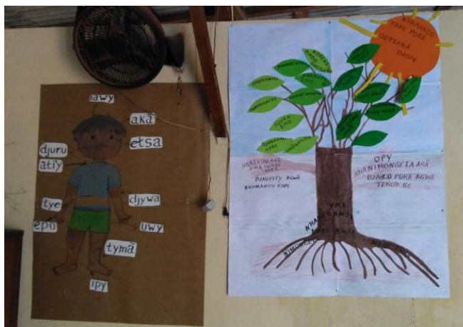
Materiais produzidos pelos professores guarani. T.I. Posto Velho