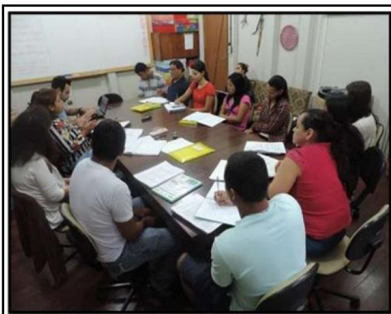
Participação de universitários indígenas da UEM em grupo de estudos. Acervo PIBID – Diversidade. 2015