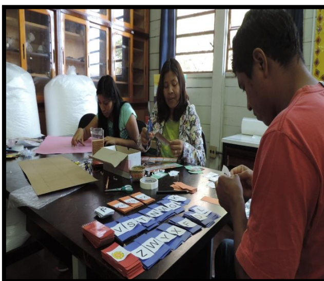
Preparação de materiais didáticos para as práticas pedagógicas. Observatório da Educação Escolar Indígena no Paraná e Saberes Indígenas na Escola. Projetos UEM-PR