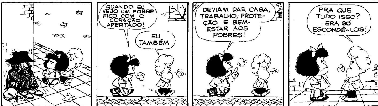
Figura 16: QUINO, 1993, p. 315