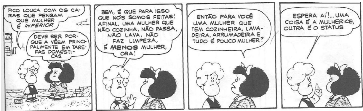
Figura 14: QUINO, 1993, p. 234

Para Susanita ser mulher é saber lavar, passar e cozinhar, e quem não sabe fazer isso é menos mulher (figura 14).