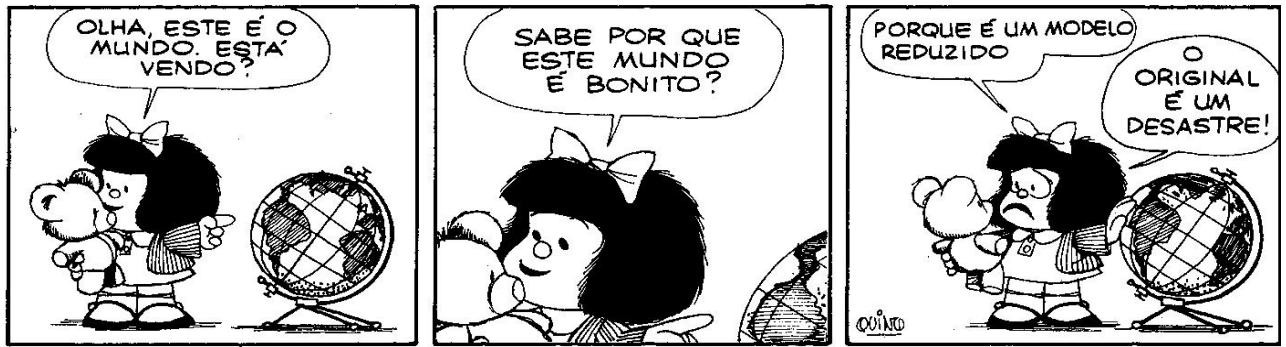
Figura 9: QUINO, 1993, p. 105