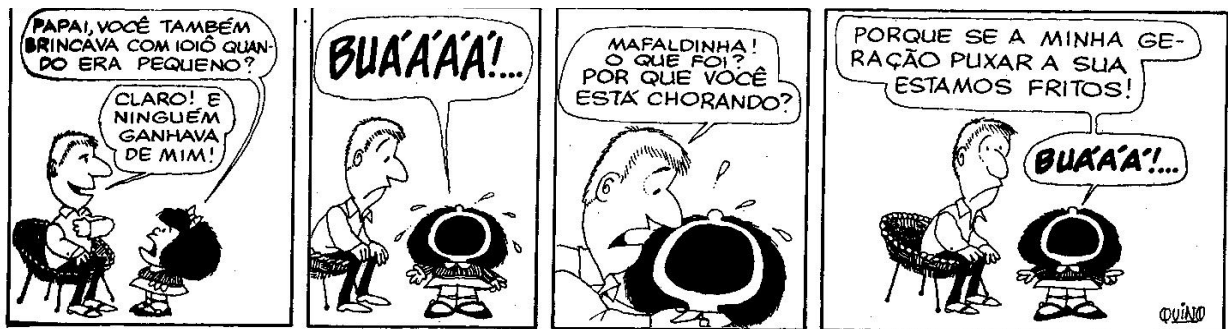
Figura 6: QUINO, 1993, p. 46