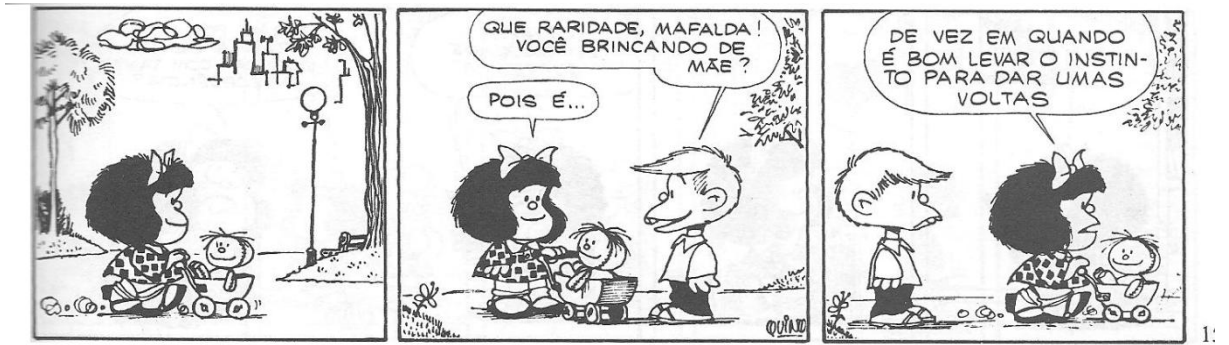
Figura 4: QUINO, 1993, p. 19

A seguir, destacamos algumas das tiras, por meio das quais, é possível conhecer e compreender algumas das principais características dessa personagem: