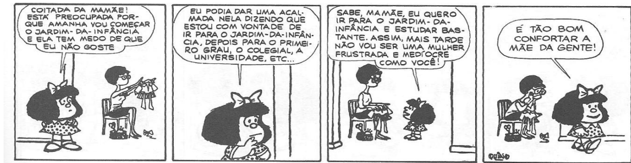
Figura 2: QUINO, 1993, p. 15

Mafalda é uma menina crítica, questiona as coisas que ocorrem a sua volta, não está satisfeita com a educação, acredita no futuro, tem esperança que o mundo pode melhorar. Ela questiona porque as pessoas são acomodadas. É uma menina que está sempre informada sobre o que ocorre no mundo e gosta de assistir jornais.