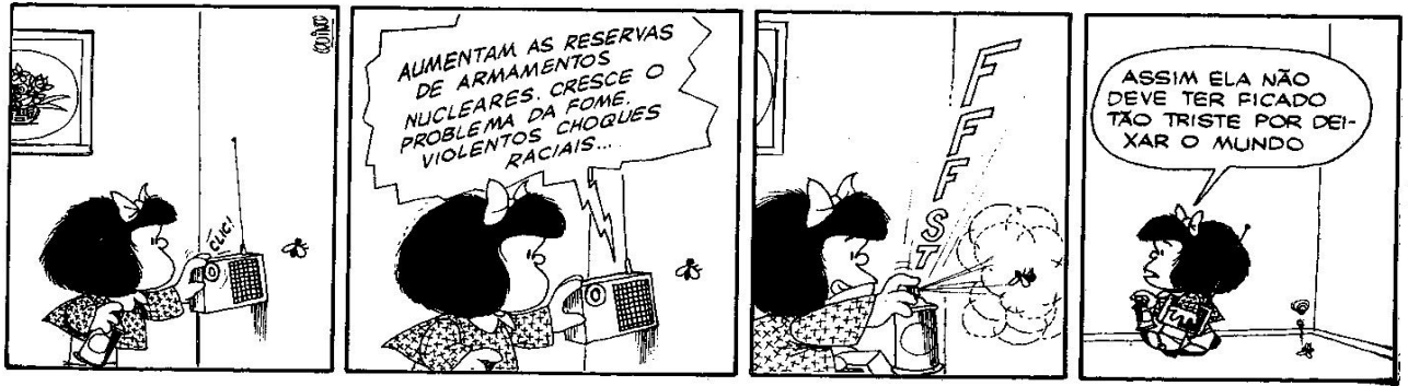
Figura 8: QUINO, 1993, p. 105