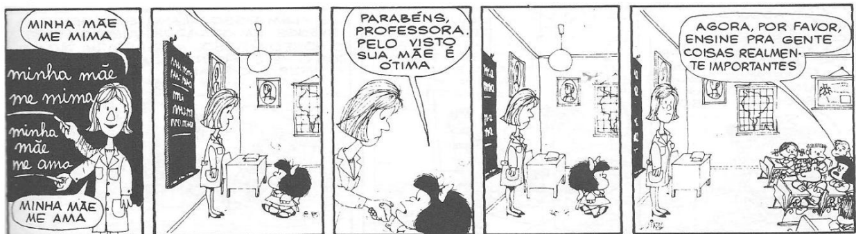
Figura 3: QUINO, 1993, p. 15

Um exemplo disso (figura 3) é quando ela está na sala de aula e fica insatisfeita, pois a professora está ensinando frases com palavras iniciadas pela letra M e ela acha aquilo sem importância. Sua expectativa era aprender sobre o mundo, sobre a política. Nesse contexto, Mafalda está com seis anos de idade, vai iniciar o primeiro ano, entusiasmada pois vai aprender ler e a escrever. Em outra tirinha, Mafalda fica, inicialmente feliz, quando a professora passa como tarefa para casa fazer risquinhos, no entanto, passa a se incomodar com esse método de ensino tradicional, pois ela acreditava que iria aprender, já no primeiro ano, notícias relacionadas ao mundo e ao invés de apenas conteúdos de alfabetização.