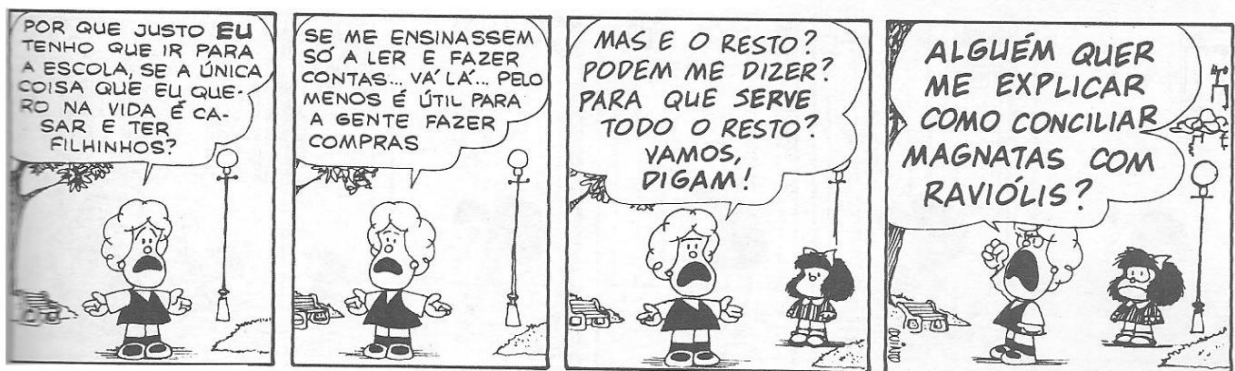
Figura 12: QUINO, 1993, p. 122

Diferente de Mafalda, Susanita é uma menina que vive sonhando. Seu único objetivo é casar e ter filhos, sofre só de pensar na possibilidade de não constituir família, não gosta de ir à escola, pois para ela a vida é a melhor escola. Ela acredita que é necessário apenas saber ler, escrever e fazer contas (figura 12) é uma menina fútil, fofqueira, preconceituosa e egoísta, implica com Manolito, pois acha que ele é um exemplo de bestialidade.