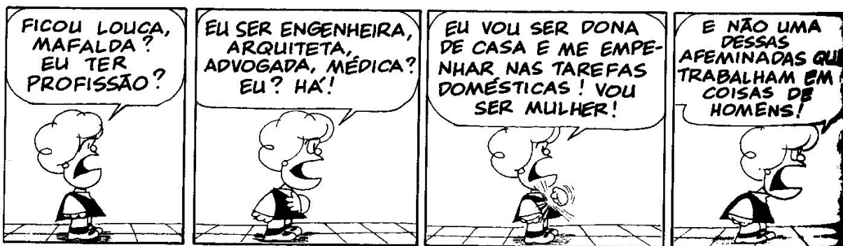
Figura 17: QUINO, 1993, p. 324