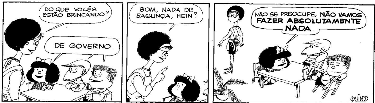
Figura 5: QUINO, 1993, p. 45

A seguir, destacamos algumas das tiras, por meio das quais, é possível conhecer e compreender algumas das principais características dessa personagem: