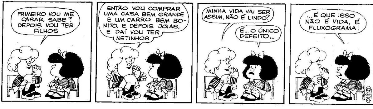
Figura 15: QUINO, 1993, p. 276