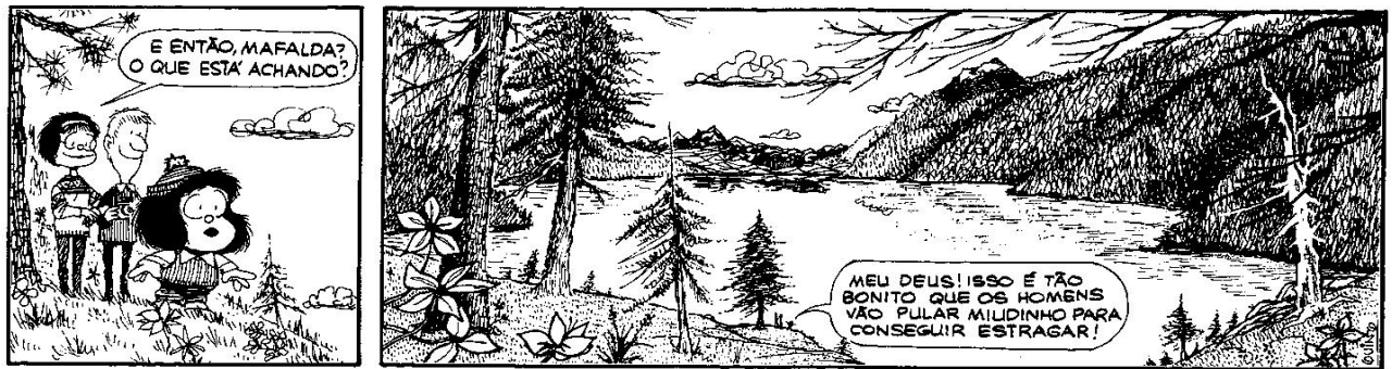
Figura 10: QUINO, 1993, p. 109