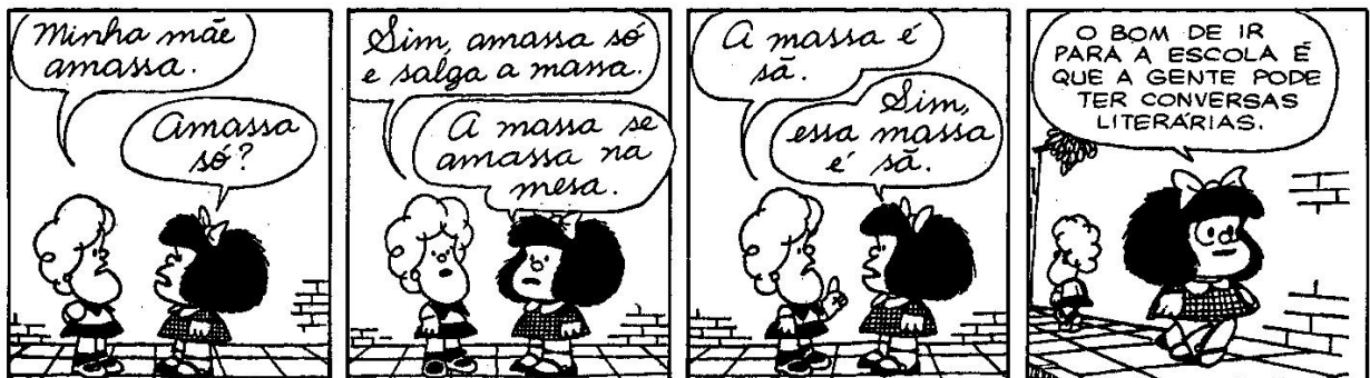
Figura 7: QUINO, 1993, p. 67