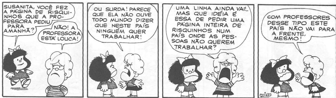
Figura 13: QUINO, 1993, p. 146

Uma das características de Susanita fica explícita quando seus amigos Mafalda e Filipe estão contentes com a professora e ela (figura 13) está brava porque a sua professora pediu para fazer uma página de risquinhos e isso para ela é muito porque as pessoas não querem trabalhar e a professora precisa entender isso.