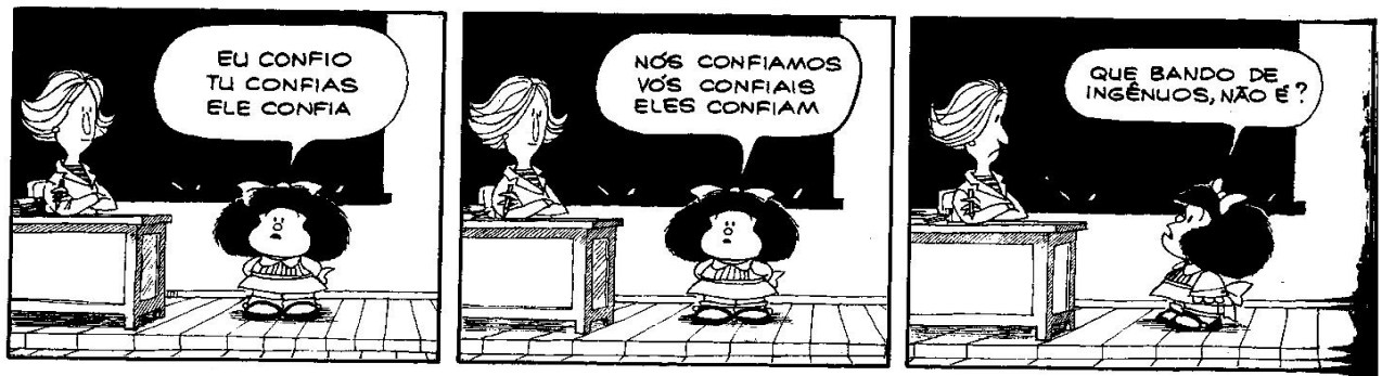
Figura 11: QUINO, 1993, p. 113